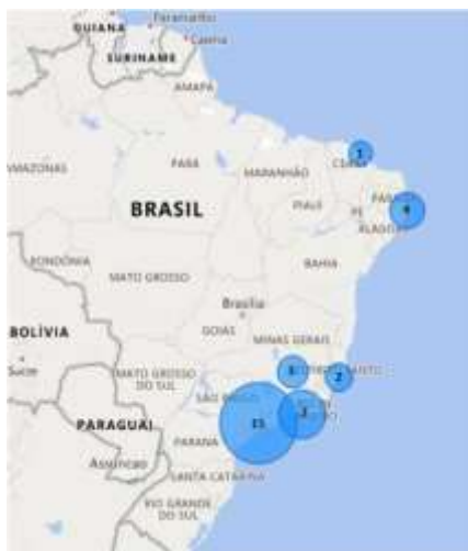
Figura 02 - Instituições por estado.