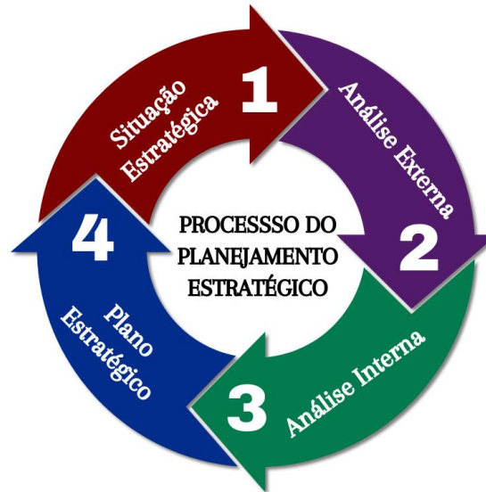
Figura 4- Principais fases do planejamento estratégico