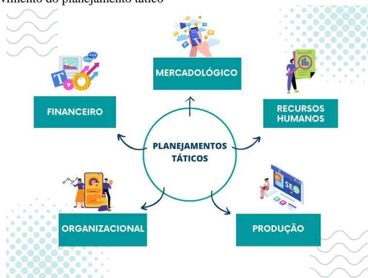
Figura 2- Desenvolvimento do planejamento tático

Segundo Oliveira (2007) tem como intenção aperfeiçoar determinada área de resultado e não a organização como um todo. Em vista disso, trabalha com dissociações dos objetivos, estratégias e políticas estabelecidas no planejamento estratégico, conforme a Figura 2.