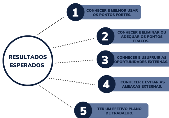
Figura 1- Resultados esperados pela organização por meio da aplicação do planejamento estratégico

O planejamento compreende em estabelecer os objetivos da organização e criar planos que possibilitem que eles sejam almeçados. Além da obrigação em ter uma orientação para a direção que a empresa deve seguir. (NOGUEIRA, 2014). Veja na (Figura 1).