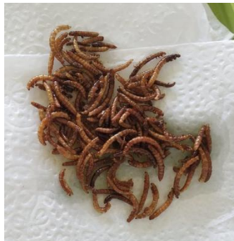
Figura 1. Larvas de Tenebrio molitor desidratadas.

Larvas de Tenebrio molitor desidratadas foram adquiridas da empresa Empório dos Animais E-commerce, Londrina-PR. Os ingredientes gelatina incolor, flocos de arroz, amendoim torrado sem casca, castanha de caju, proteína de soja desidratada, flocos de milho, semente de abóbora torrada, gergelim branco, aveia em flocos, linhaça, sal e a fumaça líquida, foram adquiridos no comércio local da cidade de Dourados-MS.