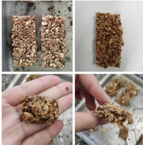
Figura 4. Barras alimentícias salgadas prontas.

Os resultados do teste sensorial de aceitabilidade são mostrados na Figura 5. O produto com adição de larvas de T. molitor apresentou maiores notas para os atributos odor, textura, cor e sabor em relação ao produto controle, que corresponde aos termos sensoriais “gostei muito” e “gostei moderadamente”, destacando-se a textura (crocante).