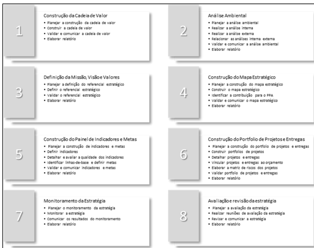
Figura 1. Modelo de Gestão Estratégica - SEDGG

garanta valor agregado e percebido pela sociedade. Nesta perspectiva a Secretaria Especial de Desburocratização, Gestão e Governo Digital do Ministério da Economia, desenvolveu um modelo de Gestão Estratégica para as organizações públicas brasileiras, conforme a Figura 1.