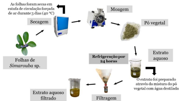
Figura 1: Representação esquemática da confecção do extrato aquoso de Simarouba sp. (SOUZA, 2021).

As folhas de Simarouba sp. foram higienizadas com água corrente, secas durante 72 horas em estufa de circulação forçada na temperatura máxima de 40°C e trituradas em moinho de facas até a obtenção de um pó fino. Para a obtenção do extrato aquoso de Simarouba sp. foi utilizado a técnica de maceração, no qual utilizou-se 3 g de matéria vegetal em 30 ml de água destilada, 1,5 g em 30 ml para a obtenção de extratos aquosos nas concentrações de 10% e 5%, respectivamente. As soluções ficaram em repouso durante 24 horas em ambiente refrigerado e posteriormente foram filtradas com papel filtro para a realização do experimento (Figura 1).